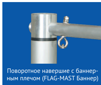
Поворотное наверхние с баннерным плечом (FLAG-MAST Баннер)