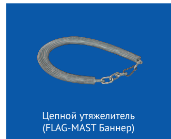
Цепной утяжелитель (FLAG-MAST Баннер)

Если вы занимаетесь оформлением АЗС, если вы сотрудничаете с крупными торговыми сетями и торговыми центрами, если в числе ваших клиентов спортивные и государственные учреждения, да и многие другие — этот продукт для вас!