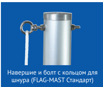
Наверхние и болт с кольцом для шнура (FLAG-MAST Стандарт)

↑ высота ↔ рекомендуемый максимальный размер флага (м) ⚖ вес нетто без аксессуаров (кг)