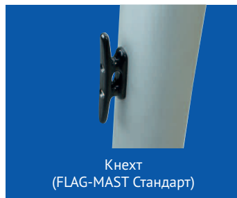
Кнехт (FLAG-MAST Стандарт)